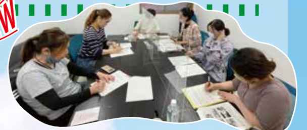
この日はSNS運営やパッケージについて話し合いました。