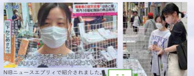
NIBニュースアプリで紹介されました。

4月から開所された「うららか」からも3日間お二人利用者さんが販売員として手伝っていただきました。販売イベントに向けてこれからもたくさん喜んでもらえる作品を皆さんと一緒に作っていききたいですね。