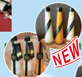
リニューアルしたドレッシングです。

2023年からは担当者も交えて2月20日に1回目、5月18日に2回目のブランディング会議を行いました。新企画提案、ブランドの浸透など話は多岐にわたります。今後も「そよ風ブランド」が地域の皆様に愛されるよう職員一同大切に育ててまいります。