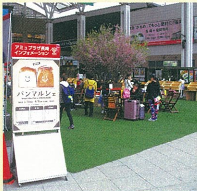
かもめ広場で開催