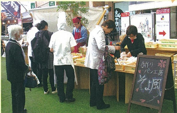
そよ風も大繁盛でした(^o^)