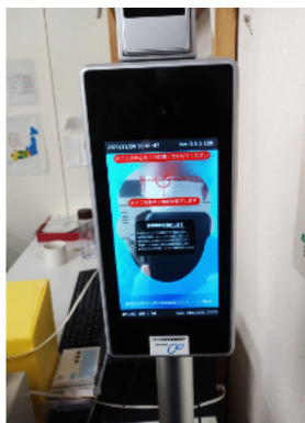
就労継続支援B型事業所 そよ風の里