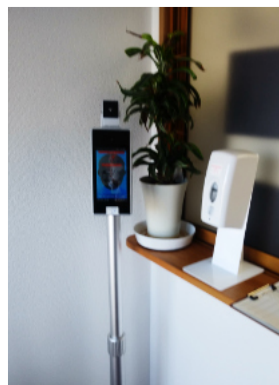
就労継続支援A型事業所 さきは風-2階