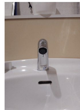
就労継続支援A型事業所 さきは風-2階トイレ