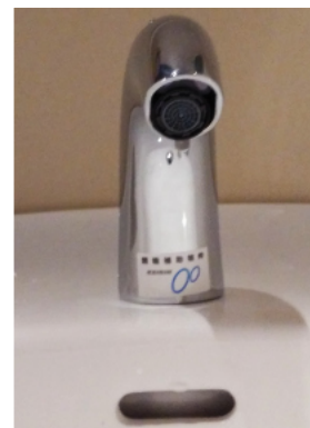
就労継続支援A型事業所 さきは風-1階トイレ