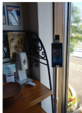
就労継続支援A型事業所 さきは風-1階